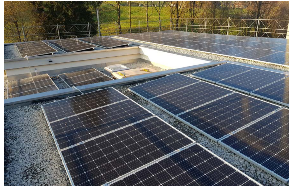
Photovoltaikanlage auf den Flachdächern