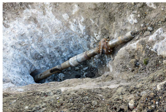
24.11.2016: Ankunft des Bohrgestänges in der Zielgrube auf dem ARA-Areal.