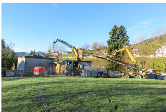
6.12.2016: Einzug des Kanalrohrs vom Brüggli her zum Ecce Homo (über die ARA).