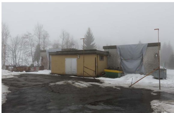
Baugespann (Mitte Februar 2018)

Mit dem Ersatz der Ölheizung durch eine Luft-Wärmepumpe und der Realisierung der Photovoltaikanlage (prognostizierte Jahresproduktion zirka 27 000 kWh) konnte den Zielsetzungen des Energieleitbildes der Gemeinde optimal entsprochen werden. Seit Inbetriebnahme im Januar 2019 lieferte die Photovoltaikanlage bis Ende Januar 2020 30 080 kWh Strom. Die prognostizierte Jahresproduktion dürfte übertroffen werden.