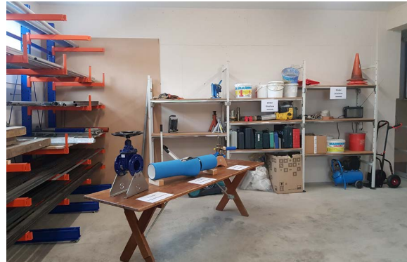
Eröffnung am 14. September 2019