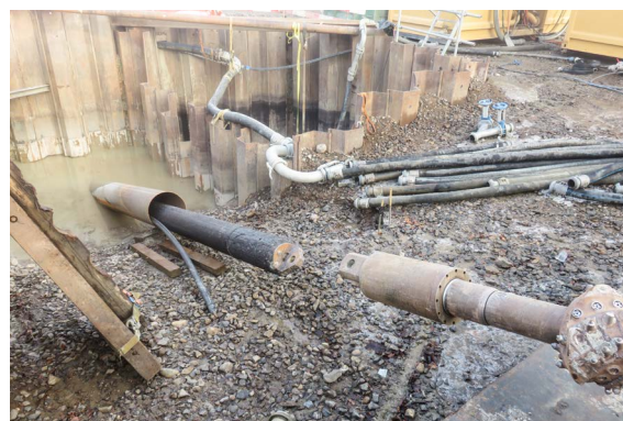
Ecce Homo: Ankunft des Kanalrohrs auf dem Baustellenplatz.