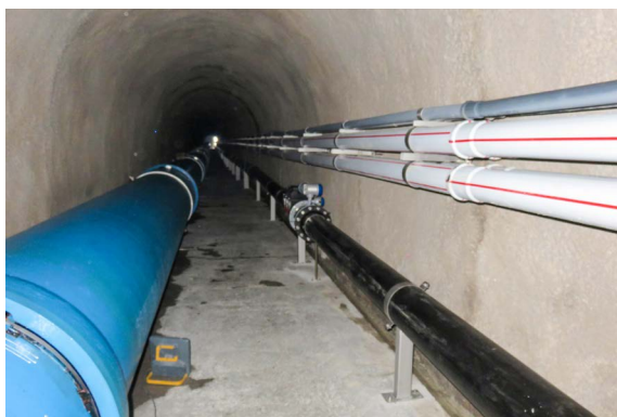
Stollen Dickli: links: Druckleitung der ebs Energie AG; rechts unten: Kanalisationsrohr der Gemeinde